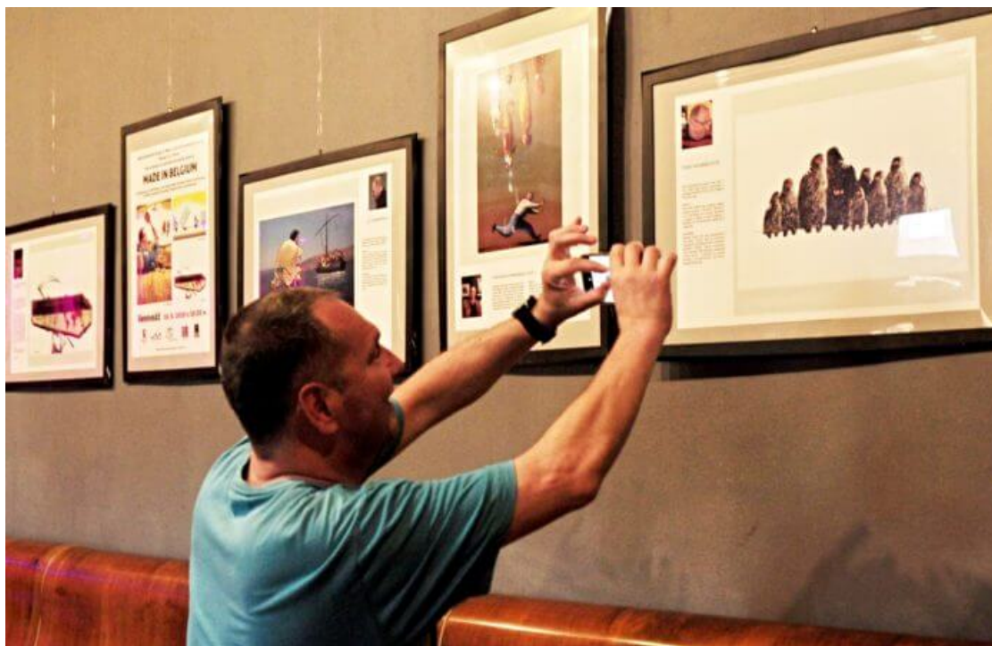
Belgium cartoons Prešov